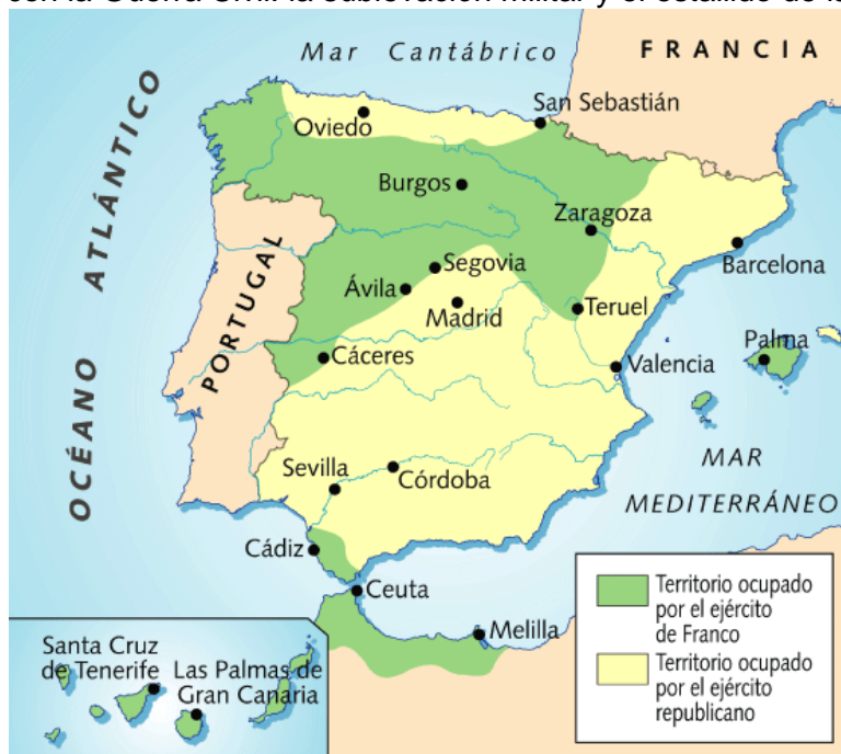
Mapa de la sublevación militar (1936) y el inicio de la Guerra Civil.

Relacione este mapa con la Guerra Civil: la sublevación militar y el estallido de la guerra.